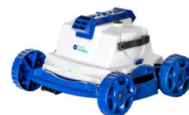
Robot Robot RKJ14