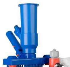
Limpiafondos Ventury Ventury vacuum 90111