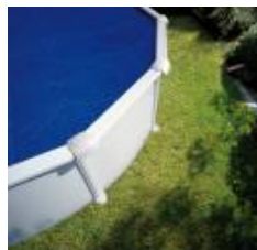
Cubierta isotérmica Isothermic cover CPROV505