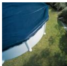
Cubierta de invierno Winter cover CIPROV501