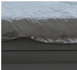
Winterabdeckung Winter cover CIKPCOR46