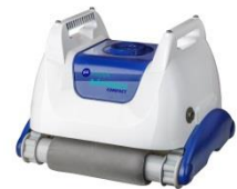
Roboter Robot RKA80