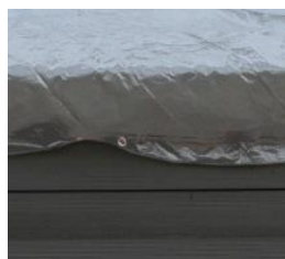
Cubierta de invierno Winter cover CIKPCOR60