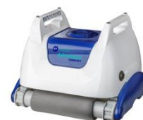
Robot Robot RKA80