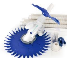
Limpiafondos automático Automatic cleaner 19007