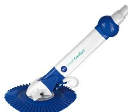
Limpiafondos automático Automatic cleaner AR20682