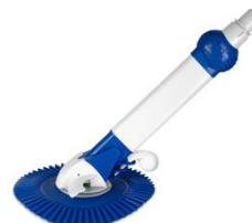
Limpiafondos automático Automatic cleaner AR20682