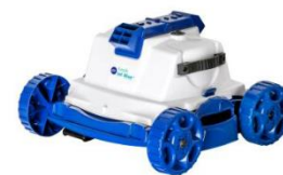
Robot Robot RKJ14