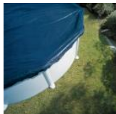
Cubierta de invierno Winter cover CIPROV501